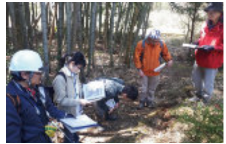
イノシシの痕跡調査（森林動物研究部門）