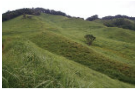
火入れにより維持されるススキ草原（生物資源研究部門）