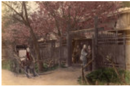
地域らしい景観の資料：古写真（環境計画研究部門）