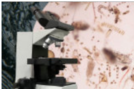
瀬戸内海のプランクトン（地球科学研究部門）