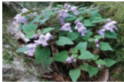
絶滅危惧種オチフジ（系統分類研究部門）