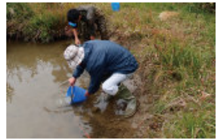
希少淡水魚の保全活動（生態研究部門）