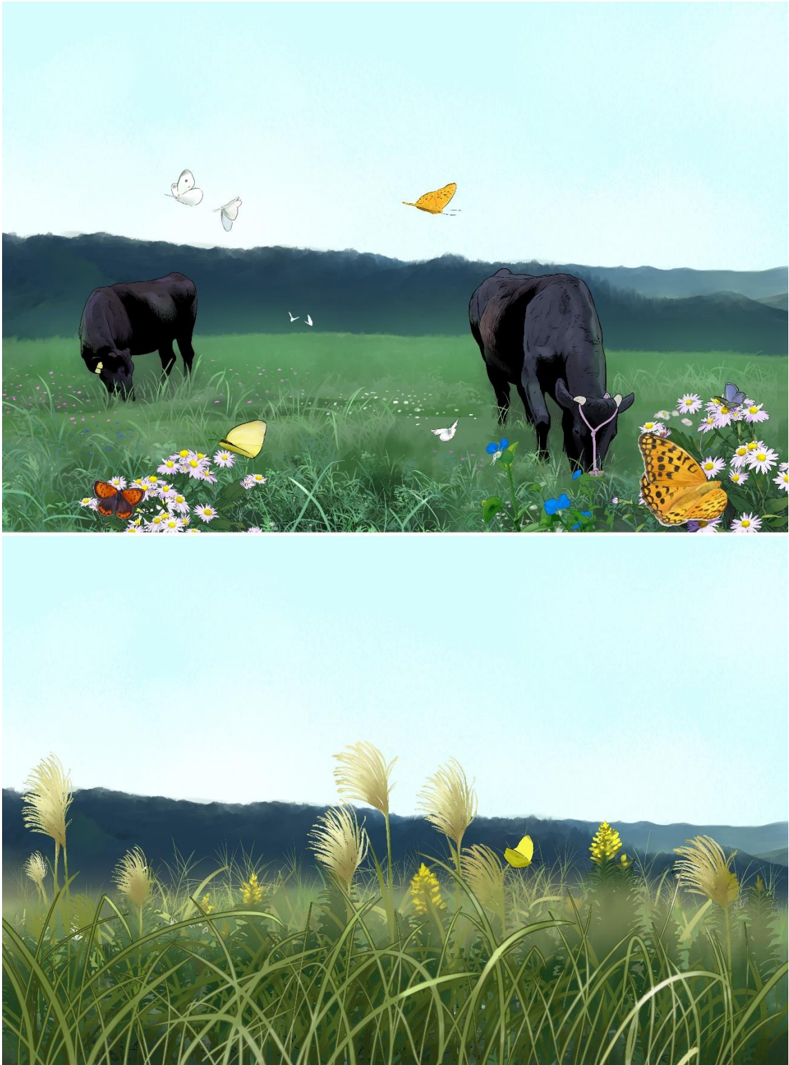
図1 (上)但馬牛の放牧地。(下)耕作放棄地。いずれも秋ごろをイメージしたイラスト。