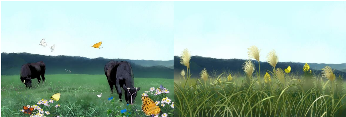
図1 研究成果のイメージ:但馬牛の放牧地(左)と耕作放棄地(右)における生物多様性

但馬牛の伝統的な放牧飼育は 2023 年には世界農業遺産にも登録されており、増加する耕作放棄地の有効利用と生物多様性保全への寄与が期待できます。