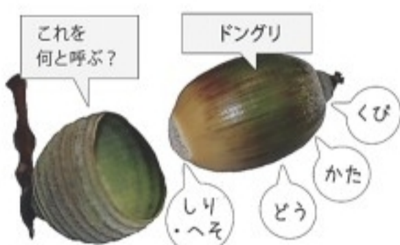
(図2) ドングリの各部の名称

私は園などでドングリの話をするときに、殻斗を指さして「これを何と呼びますか?」と聞くようにしています。皆さんに「帽子」と言ってもらった後、「私も言います。ドングリの各部位を人の身体の部分のような名前(くび、かた、どうなど)で呼ぶことがあります(図2)。枝に付いているときに殻斗とつながっている部分を「しり・へそ」と言います。したがって殻斗は、ドングリの「しり・へそ」を隠しているものです。