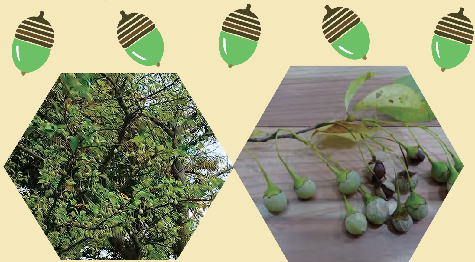
エゴノキにもたくさんの実がなっていました

この種類の仲間は南方の熱帯 ねったい に多く生で食べることもできるものもあるよ。枝に実がなる