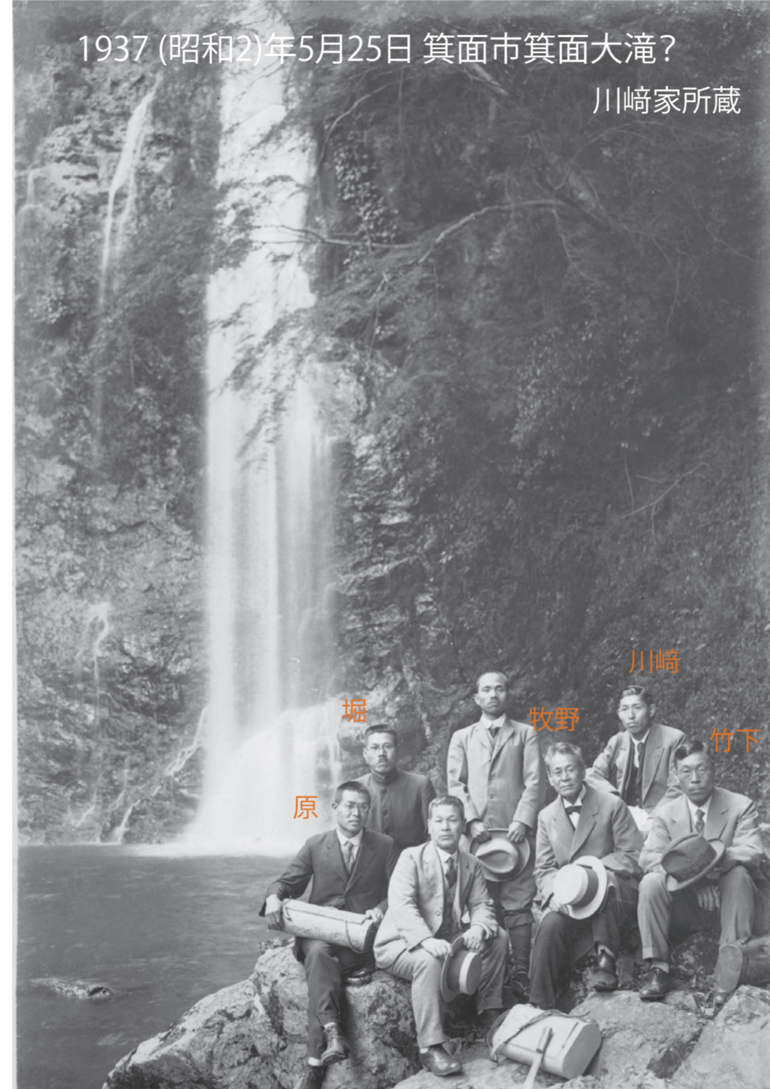
1937 (昭和2)年5月25日 箕面市箕面大滝?