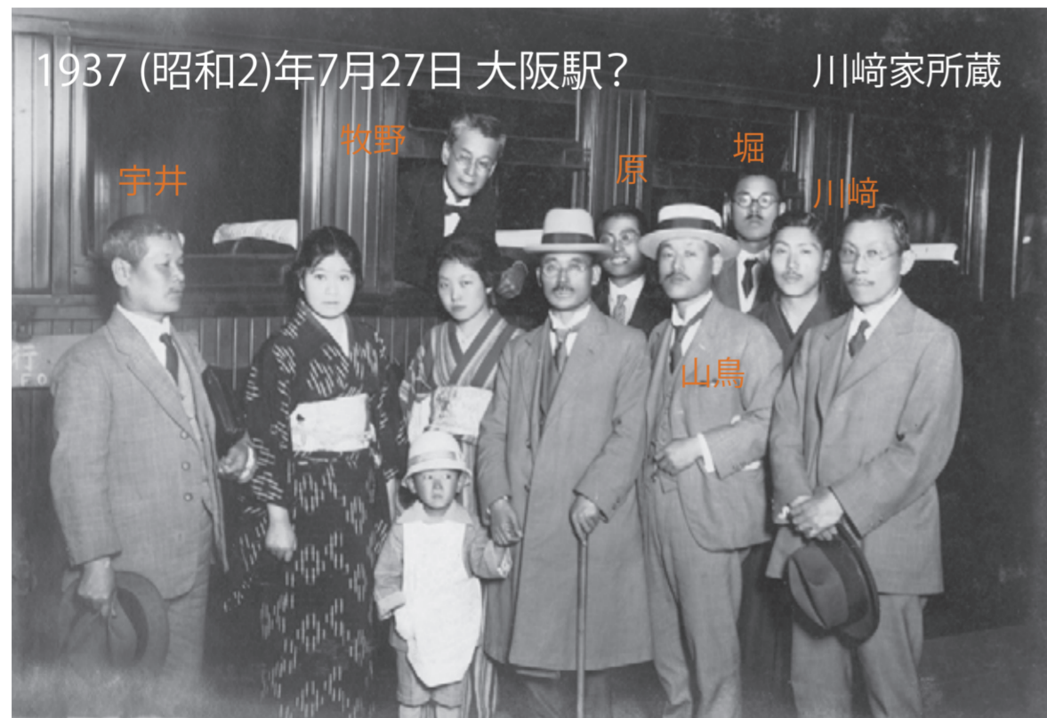
1937 (昭和2)年7月27日 大阪駅?