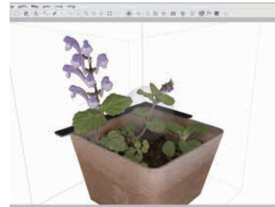
図3 3Dモデルにテクスチャを貼り付けて完成。様々な角度から拡大して観察できます。