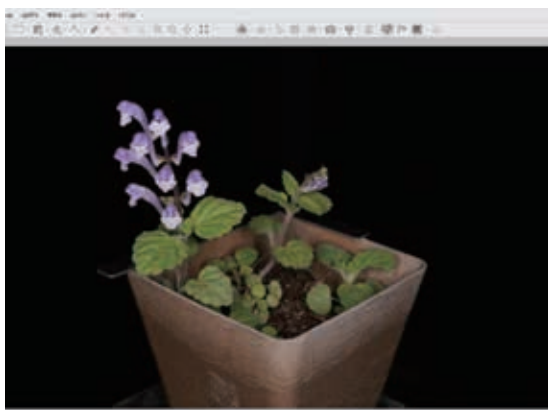
図1 スナップ写真。3Dモデルを得るには様々な角度から撮影した写真が大量に必要です。

2年の試行錯誤で上記の撮影手法の必要条件と撮影手技について解明しました。今後は、誰でもフォトグラメトリに適した写真を短時間に撮影できる補助具の開発を行い、立体植物図鑑の実現に向けた環境を整えます。