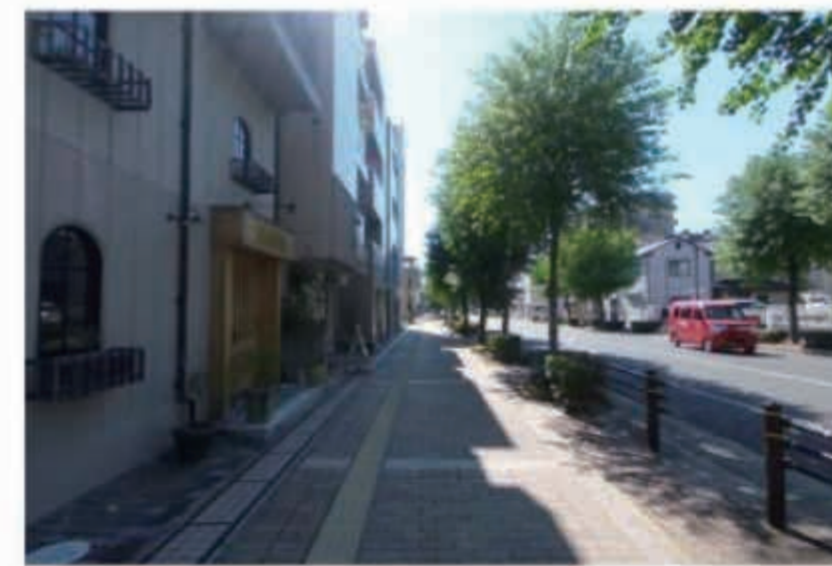
パターン1(平均6.5mスパン)