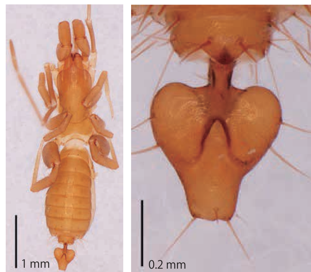
ザウターヤイトムシと混同されていた未記載種. 右の写真は、腹部末端の器官. 産地：沖縄島