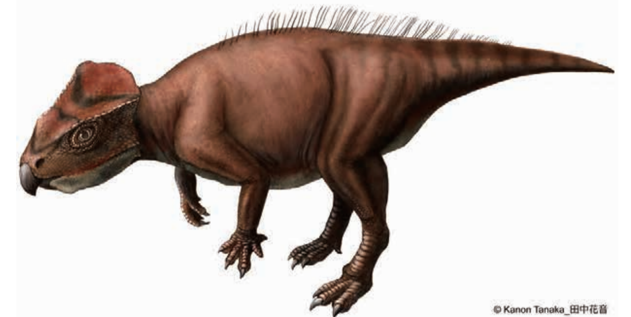
【図1】ササヤマグノームス・サエグサイの生体復元図 丹波篠山市産・全長約80cmの小型植物食恐竜（角竜類）

ササヤマグノームスの研究によって、小さな角竜たちがアジアから北米を目指す「グレートジャーニー」が始まったのは、約1億1000万年前だったということがわかりました。丹波篠山市で見つかった小さな化石は、生まれ故郷のアジアから、新大陸を目指した角竜の旅路を伝える重要な化石だったのです。