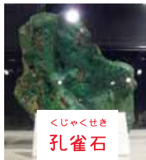
くじゃくせき 孔雀石