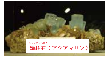
りよくちゆうせき 緑柱石（アクアマリン）